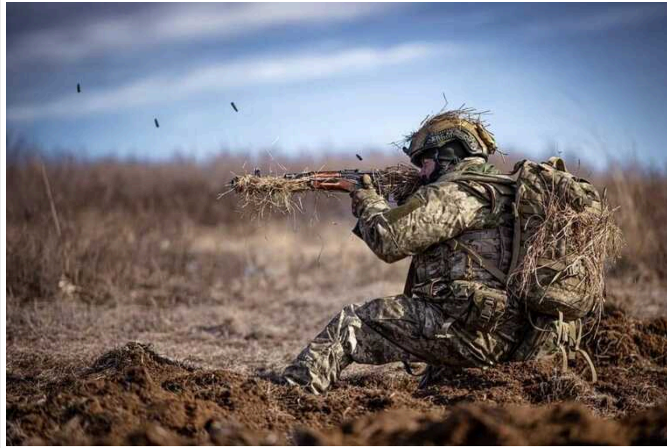
Ситуація на фронті: Ворог активний на трьох напрямках, від початку доби - понад сотню боєзіткнень

Сьогодні, 25 липня, від початку доби на лінії фронту відбулось 103 бойових зіткнень. Ворог активний на трьох напрямках.