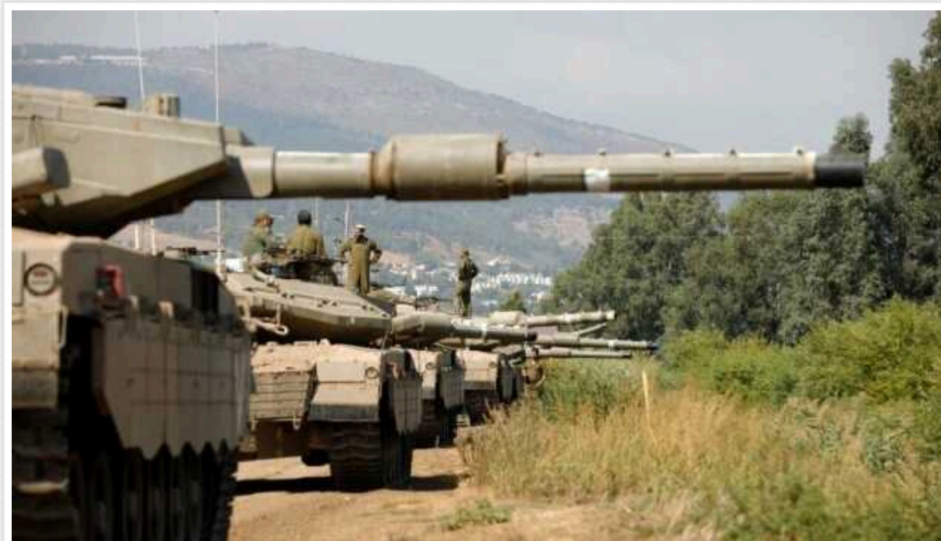
Reuters: Переговори про перемир'я у Секторі Гази перебувають на завершальній стадії

Переговори щодо угоди про припинення вогню у Секторі Гази та звільнення заручників, схоже, перебувають на завершальній стадії.