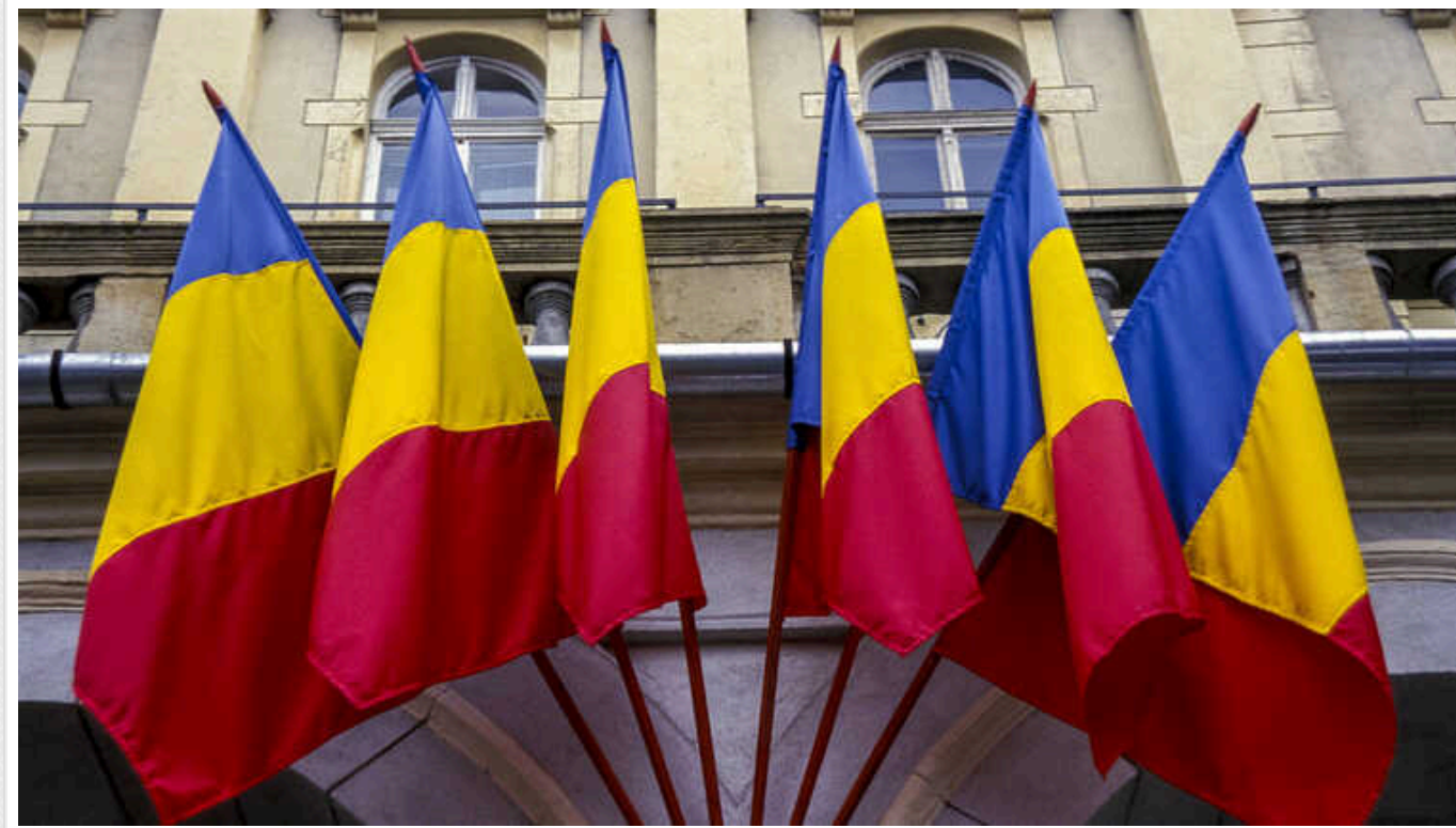
У МЗС Румунії підтвердили, що уламки "Шахедів" виявили на території країни

Глава відомства Лумініца Одобеску повідомила, що МЗС вже поінформувало союзників про цей інцидент та "координує з ними свої дії".