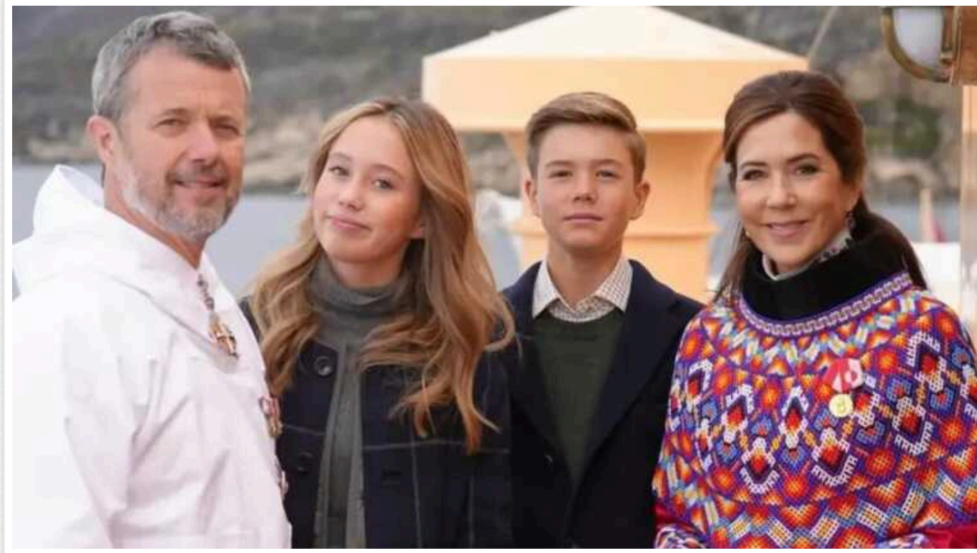
У столиці Гренландії на королеву Данії Мері наїхав скутер, коли вона з родиною вітала шанувальників

Від удару її Величність впала, але швидко підвелася. Літній чоловік, який керував скутером, був шокований тим, що трапилося, не менше за інших.