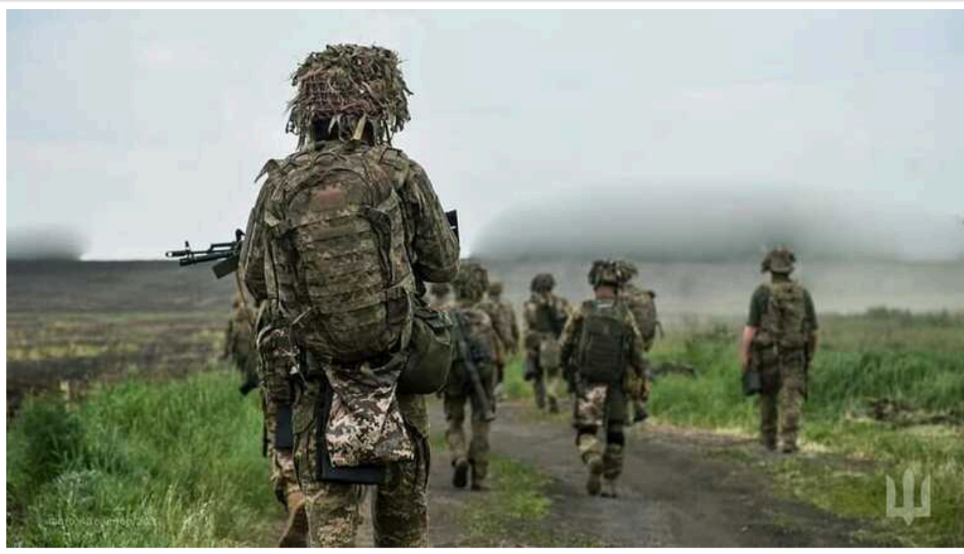
Бійці 31-ї бригади вийшли з оточення біля Прогреса, - DeepState

Вночі бійцям 31-ї окремої механізованої бригади вдалося вирватися з оточення російських окупантів північніше від села Прогрес на Донеччині.