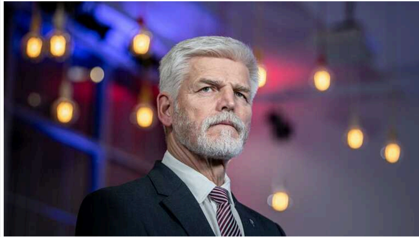
Президент Чехії Павел закликав залучити Росію та Китай до мирних переговорів щодо України

Особливо важливою є участь Китаю - як "великого глобального гравця", який зможе вплинути на Москву, заявив Петр Павел в інтерв'ю виданню СТК.