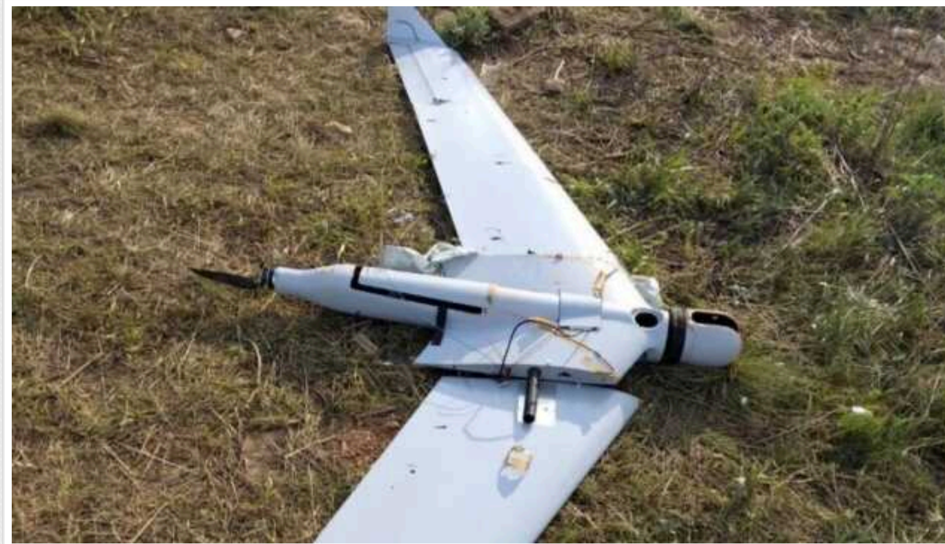
У Росії почали залучати "кулібіних" для кустарного виробництва дронів

БПЛА зроблений з матеріалів, доступних у будівельних маркетах. Але дрони-камікадзе, наголошують у Defence Express, і не вимагають тривалої експлуатації.