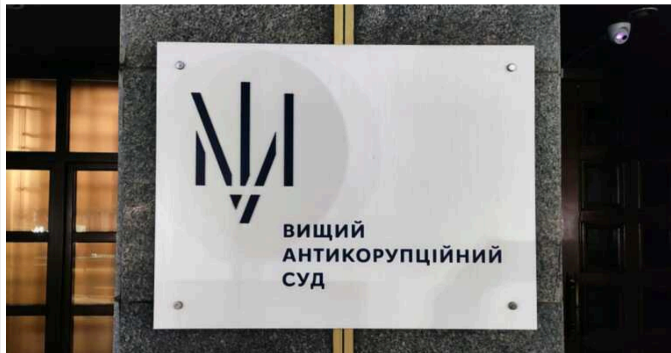
Вищий антикорупційний суд стягнув у дохід держави майно посадовця ДБР та його дружини-прокурорки

ВАКС визнав необґрунтованими низку активів, що належать заступнику начальника одного з управлінь центрального апарату ДБР і його дружині-прокурорці.