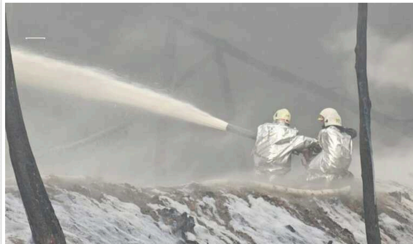
У мережі публікують фото пожежі з місця прильоту по об'єкту інфраструктури в Житомирській області