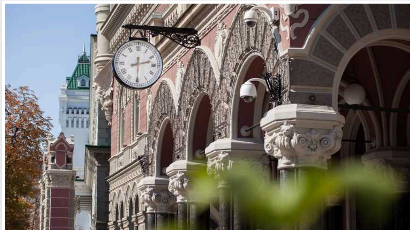
Непослідовність НБУ: чому «Даймонд Пей» все ще працює, а кошти не арештовані?

Я дуже дуже вибачаюсь, що турбую керівництво НБУ, та розумію вашу завантаженість, але хочу нагадати про одну незавершену справу.