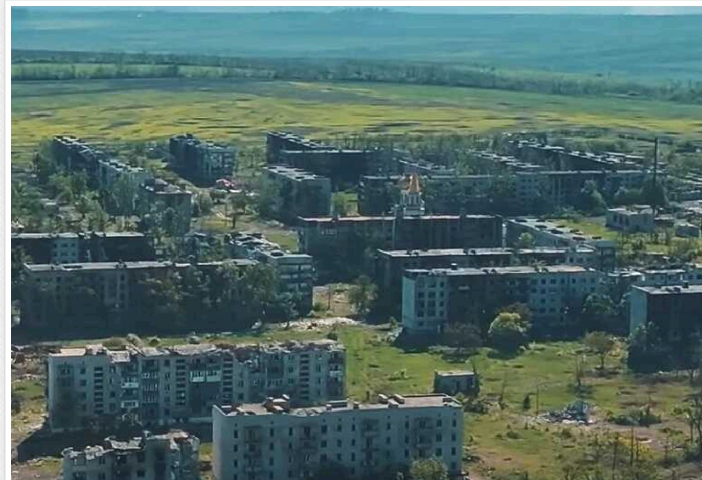
Окупанти у районі Часового Яру намагаються атакувати на ділянках, де канал йде під землею

На напрямку Часового Яру ворог намагається атакувати на ділянках, де канал йде під землею. Окупанти тут ведуть штурмові дії, переважно використовуючи живу силу без підтримки бойової броньованої техніки.