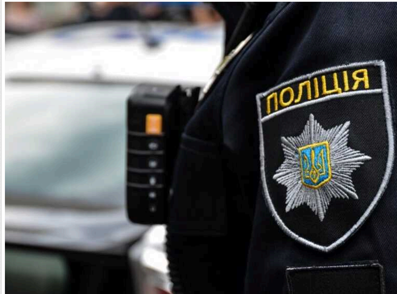
У мережі показали відео, як в Одесі чоловік у військовій формі бив та тягав за волосся дівчину

У місцевих пабліках з'явилось відео, як в Одесі чоловік у військовій формі бив та тягав за волосся дівчину.