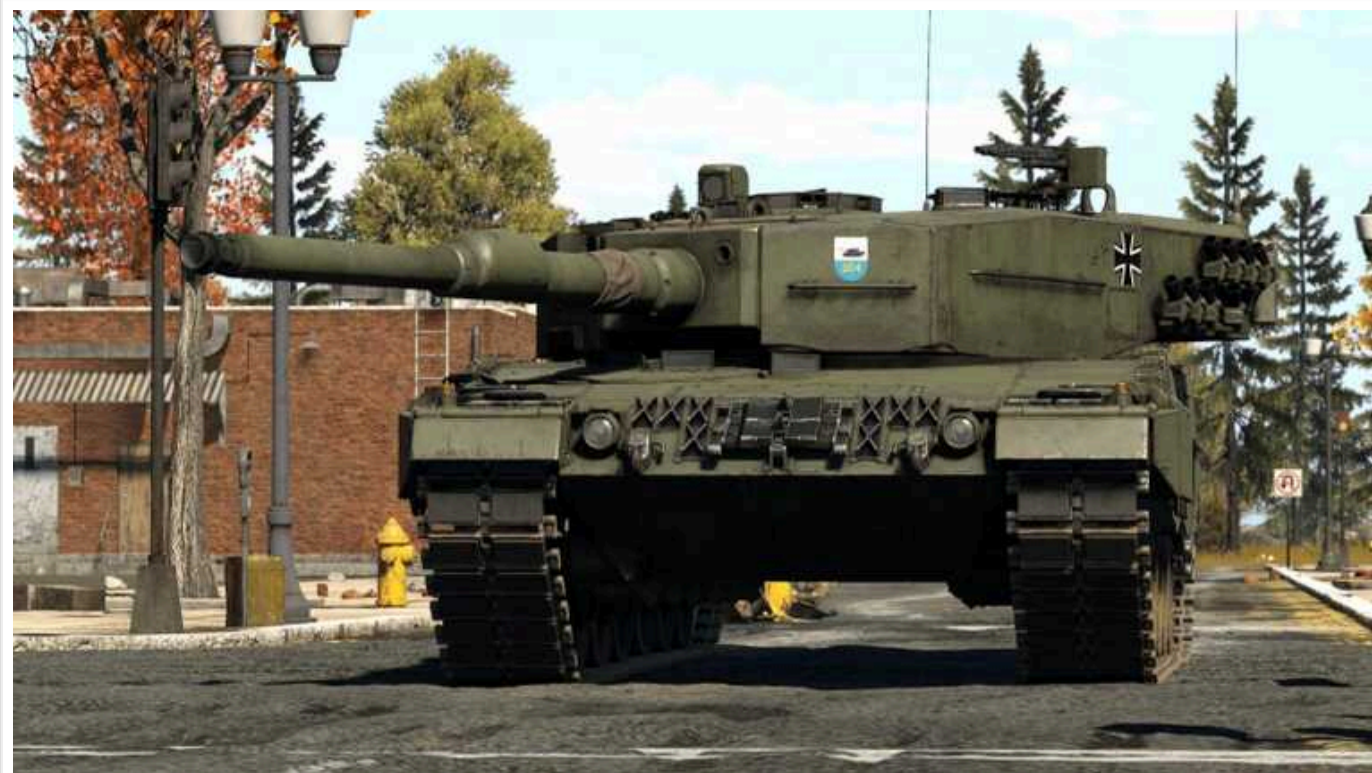
Україна отримає партію танків Leopard від Данії та Нідерландів до кінця літа

Нідерланди оголосили про постачання Україні партії танків Leopard 2A4, яку вони придбали разом із Данією. Партія з 14 танків Leopard 2A4 вирушить до України вже цього літа.