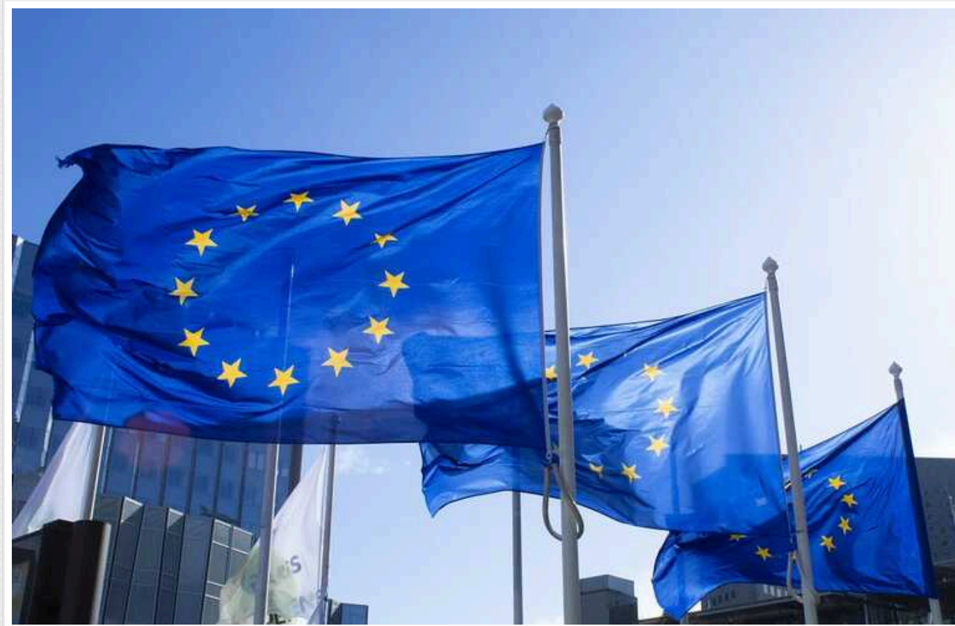
Дві третини громадян ЄС вважають, що в їхній країні процвітає корупція, – Politico

Понад дві третини (68%) громадян Європейського Союзу вважають, що в їхній країні широко поширена корупція.