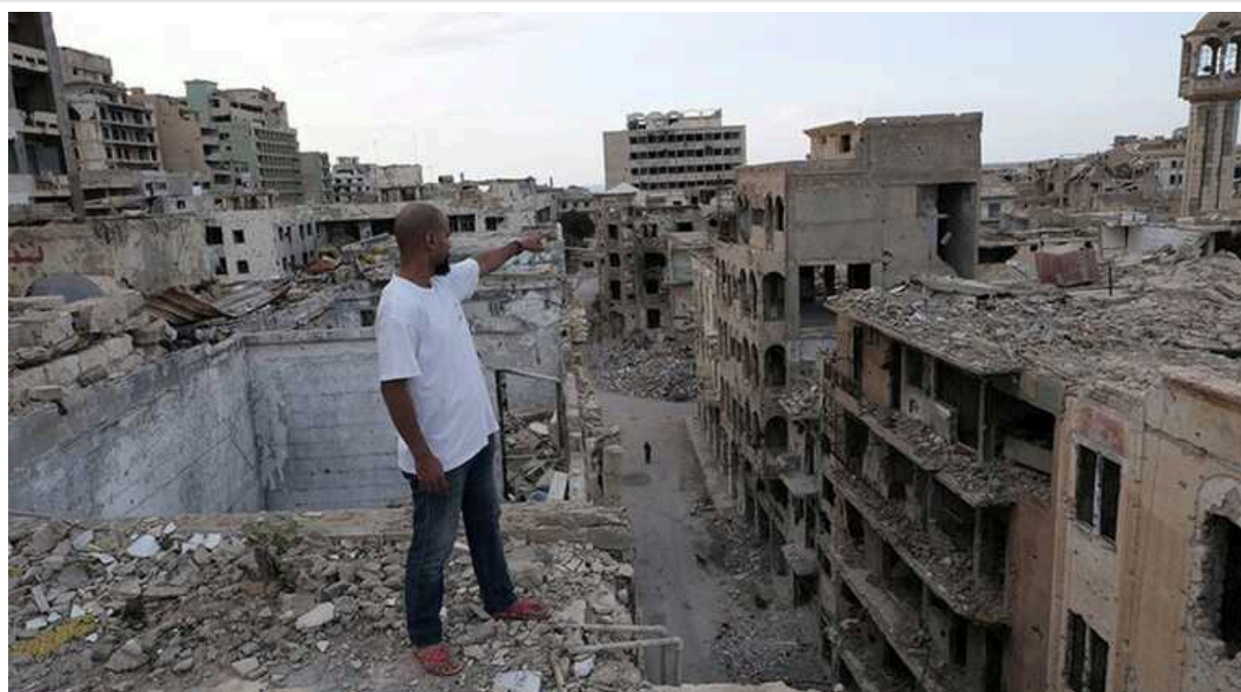
Reuters: Росія завалила Лівію фальшивими грошима

Джерела повідомляють, що фальшиві динари імпортувалися із РФ, або друкувалися на місці.