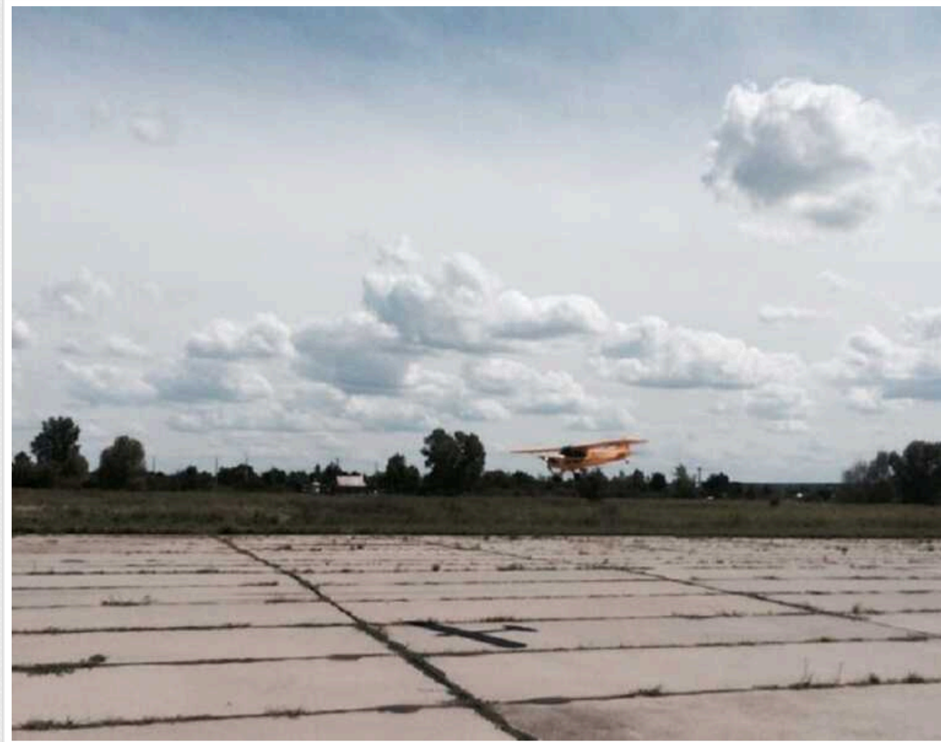
У РФ у Самарі партизани спалили гелікоптер для підготовки парашутистів

Гелікоптер розміщувався на місцевому аеродромі "Кряж". Він згорів практично вщент.