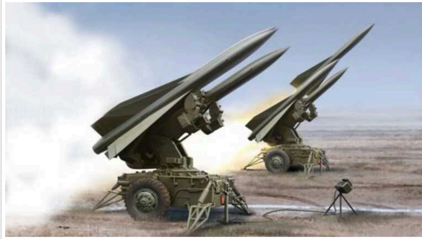
Іспанія передасть Україні систему ППО Hawk

У вересні 2024 року Іспанія планує передати Україні зенітно-ракетні комплекси Hawk, щоб підвищити потужність ППО нашої країни.