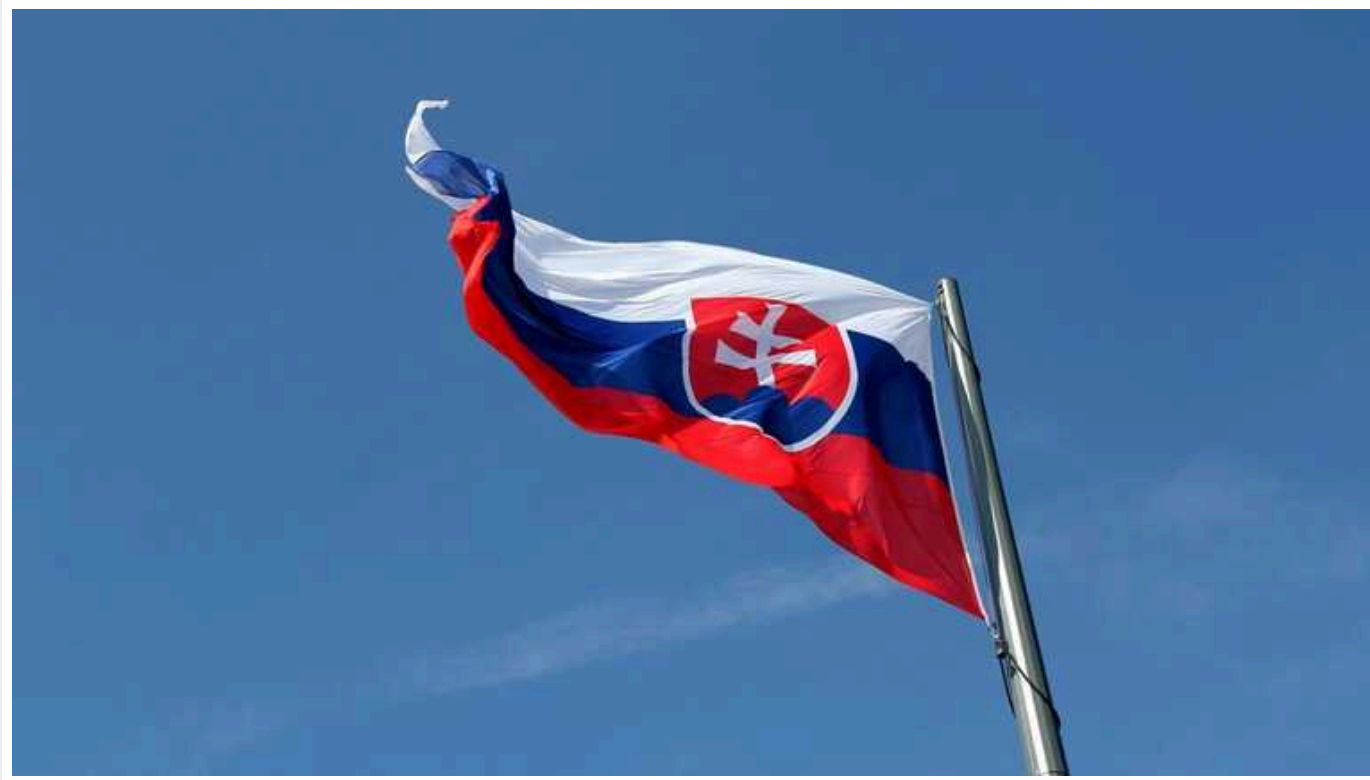
В Євросоюзі застерegli Словаччину від свого закону про іноагентів

Європейська комісія попередила Словаччину, що розпочне негайні судові заходи, якщо країна ухвалить закон, що передбачає обмеження на діяльність неурядових організацій та ЗМІ.