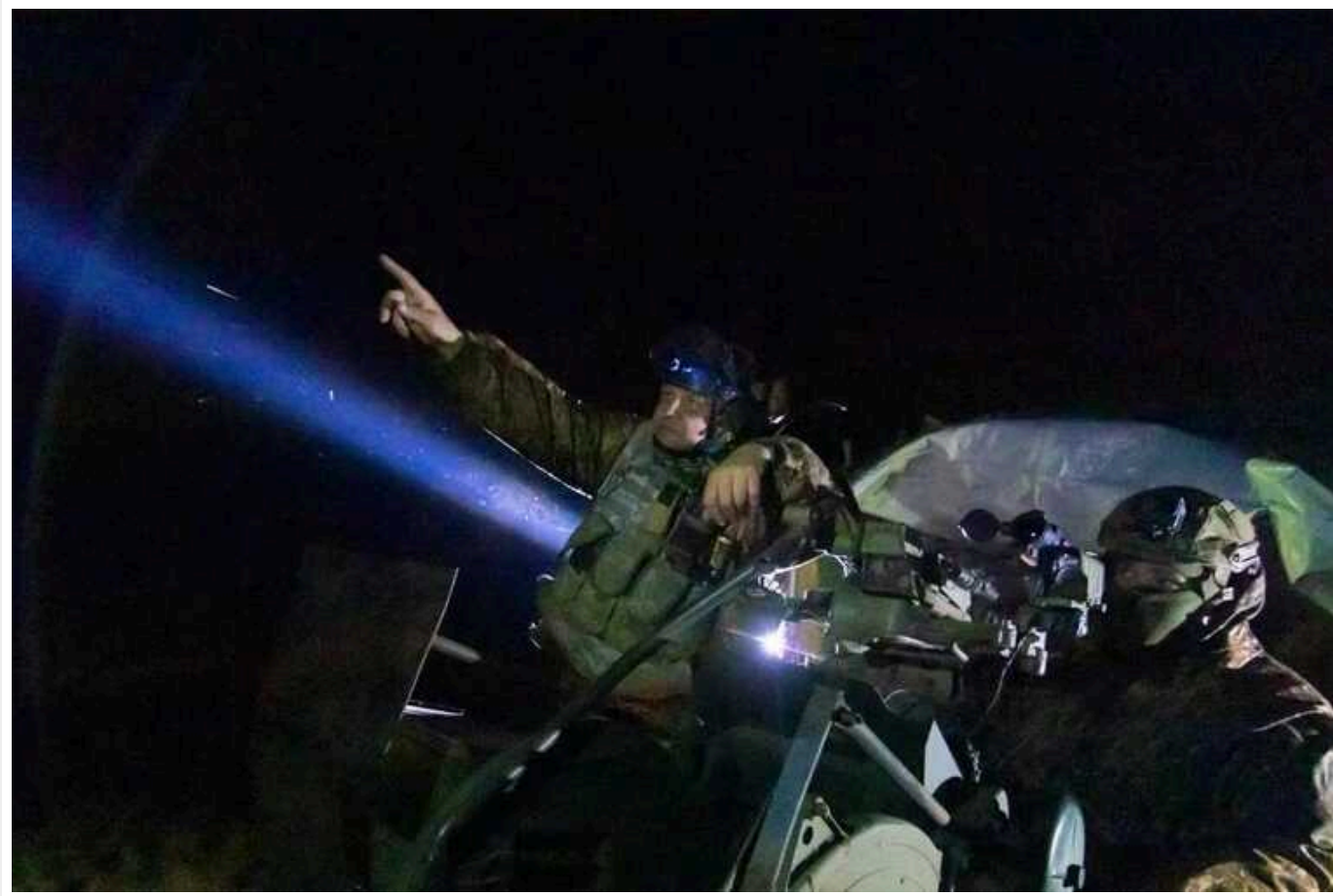
Окупанти вночі атакували Україну 38 «шахедами»: 25 дронів знищено, три – «загубилися» на кордоні з Румунією

Російські окупанти вночі атакували об'єкти інфраструктури на півдні Одещини та у центральних регіонах України 38 ударними БПЛА Shahed-131/136. Безпілотники запускали з південного напрямку – мису Чауда, Крим та Приморсько-Ахтарська.