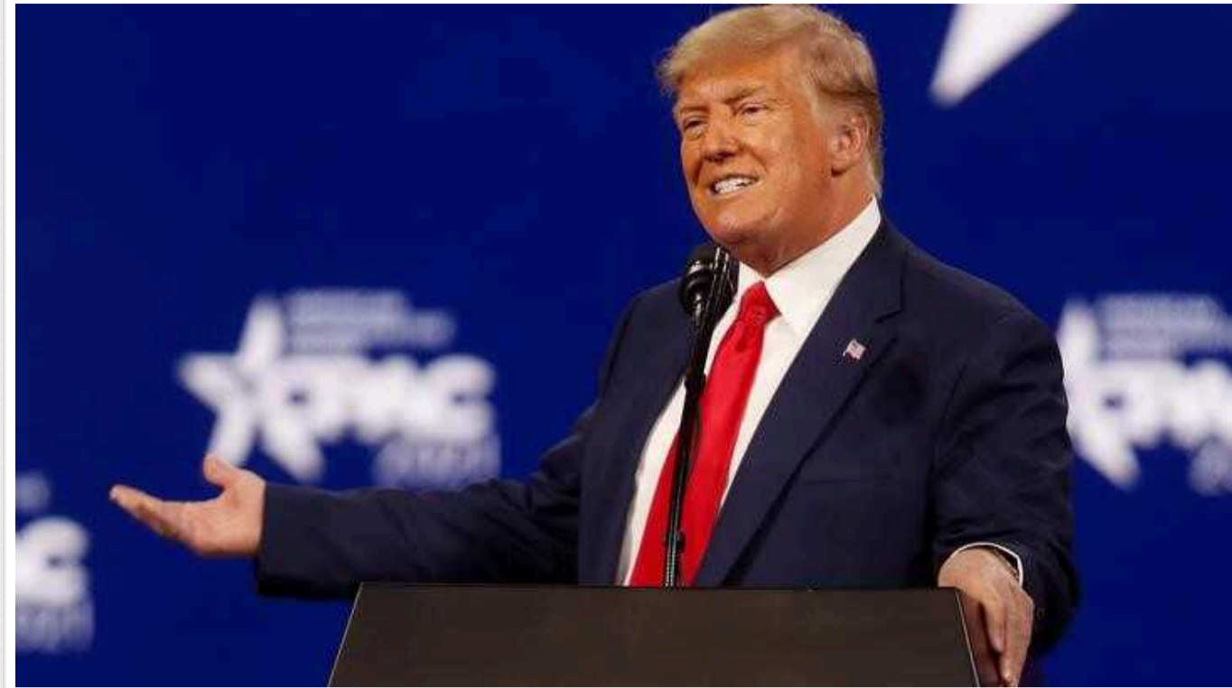
Трамп відреагував на виступ Байдена в Овальному кабінеті: «Дуже погано і ледь зрозуміло»

Кандидат у президенти США від Республіканської партії Дональд Трамп назвав промову президента Джо Байдена, присвячену виходу з передвиборчих перегонів, «дуже поганою» і «ледь зрозумілою».