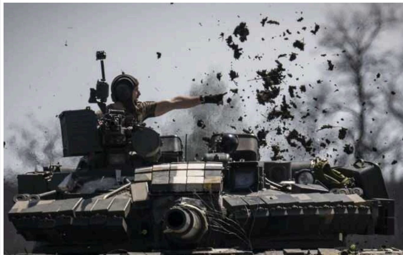
В ISW розповіли про фактори, що допоможуть ЗСУ провести вдалий контрнаступ

Росія починає відчувати дефіцит озброєнь і особового складу. Це, а також допомога західних партнерів, дозволять ЗСУ з часом проводити успішні контрнаступальні операції.