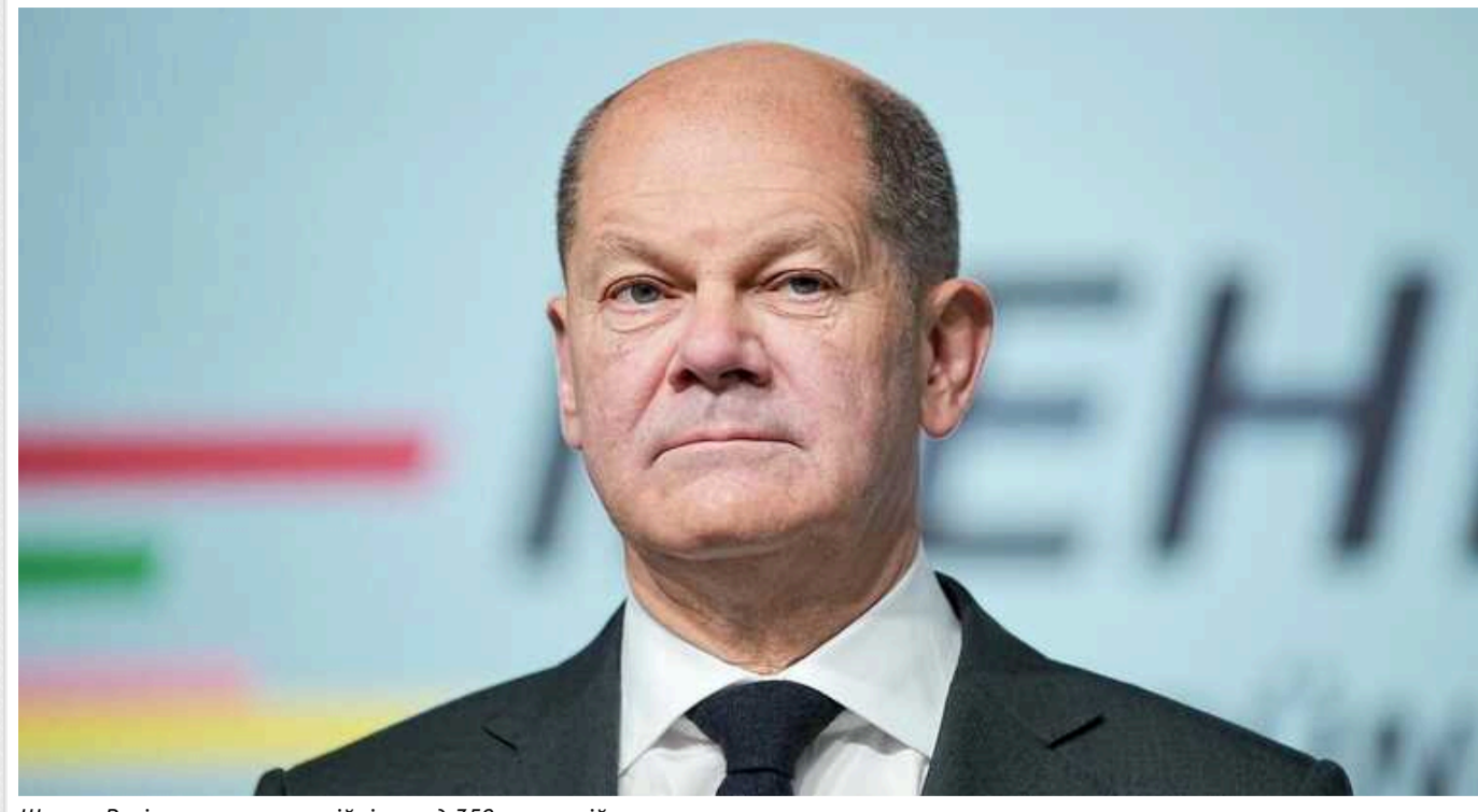
Шольц: Росія втратила на війні понад 350 тисяч військових

За час повномасштабної війни проти України Росія втратила пораненими та вбитими понад 350 тисяч військових.