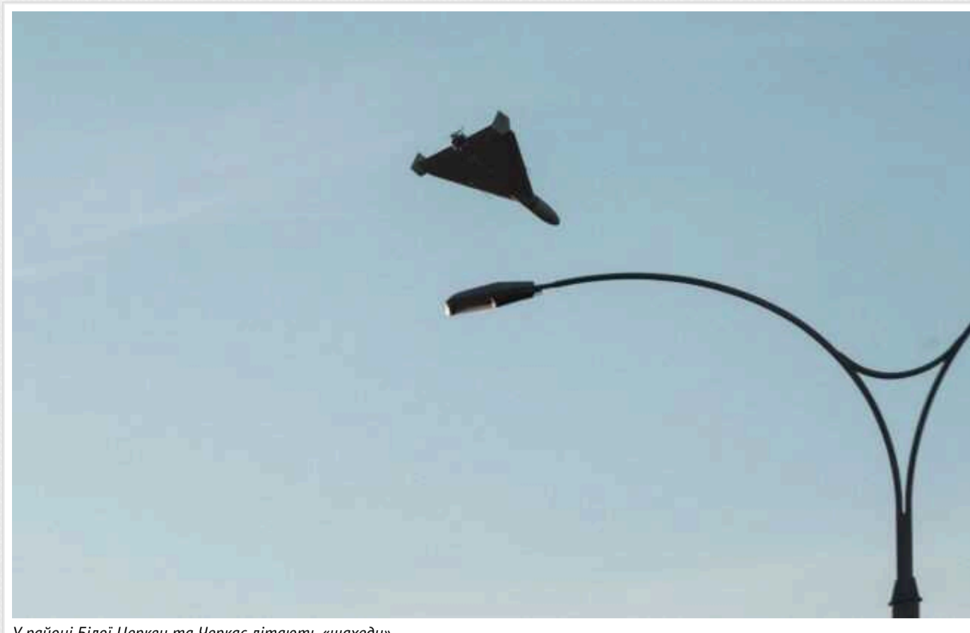
У районі Білої Церкви та Черкас літають «шахеда»

“Фіксується “шахед” в районі Білої Церкви Київської області”, – ПС