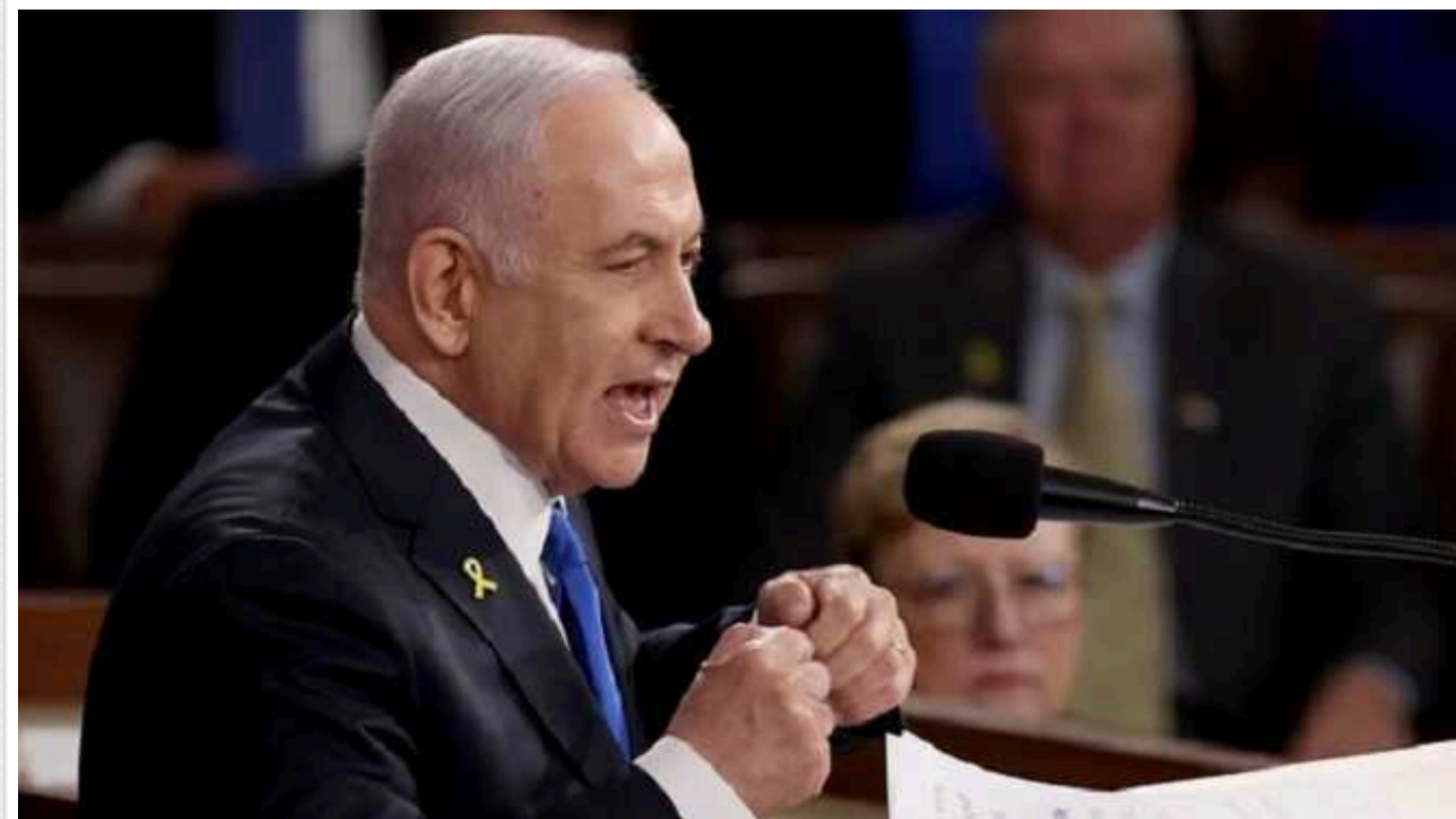
Нетаньягу у Конгресі США розкритикував тих, хто підтримує «варварів ХАМАС»

Прем'єр-міністр Ізраїлю Беньямін Нетаньягу виступив у Конгресі США і заявив, що ЦАХАЛ продовжуватиме вести війну в Газі, поки весь військовий потенціал ХАМАСу не буде знищено. Тих, хто бере участь в антиізраїльських мітингах, він розкритикував, зазначивши, що вони стоять поряд із вбивцями та ґвалтівниками.