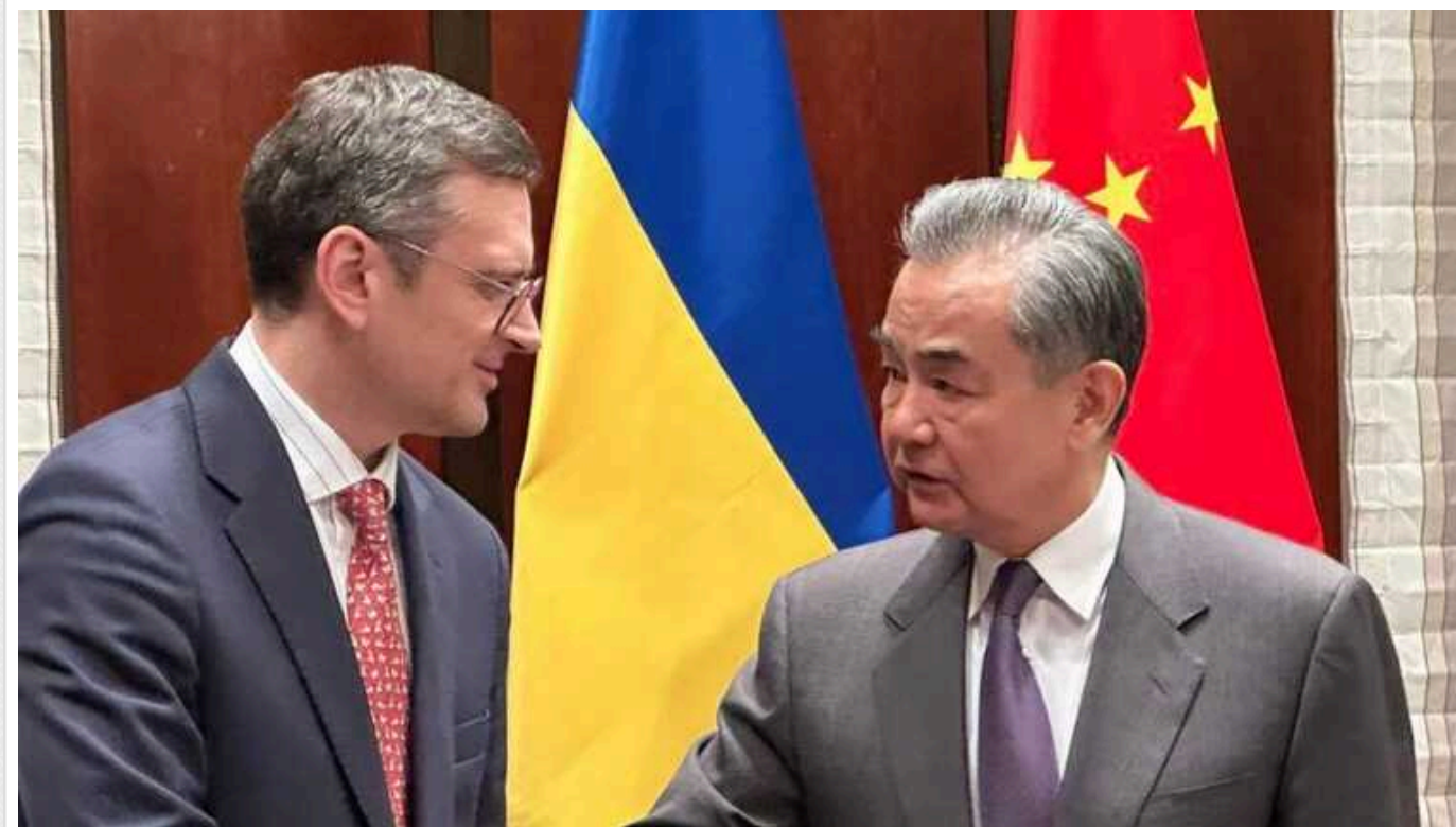
Кулеба розповів про зустріч з китайським колегою Ван І: «Україна не прогнеться ні під чії ультиматуми»

Міністр закордонних справ України Дмитро Кулеба після переговорів у Китаї наголосив, що наша держава ніколи не погодиться на ультиматуми у питанні завершення війни. Водночас у Пекіні погоджуються, що у питанні російсько-української війни потрібно досягти сталого миру, а не його ілюзії.