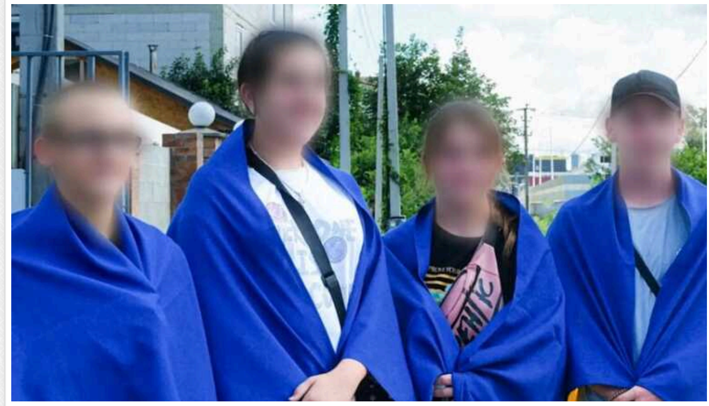
3 тимчасово окупованих територій повернули ще 7 українських дітей

Україні вдалося повернути на підконтрольну територію ще сімох дітей з тимчасово захоплених російськими військами міст. Діти опинилися в безпеці завдяки зусиллям організації Save Ukraine, а також програми "Bring Kids Back UA", що була створена за ініціативою президента Володимира Зеленського 2023 року.