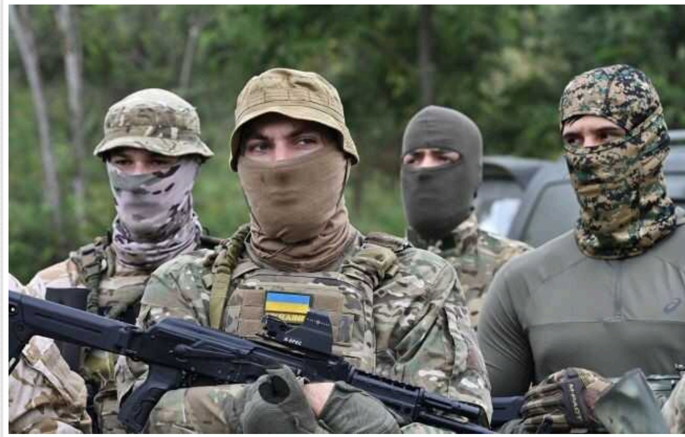
У ЗСУ розповіли, як ворог змінив тактику штурмів на Лиманському напрямку

Війська Росії протягом 11 місяців намагаються активно штурмувати позиції Сил оборони України на Лиманському напрямку на Донеччині. Проте останнім часом ворог змінив тактику.