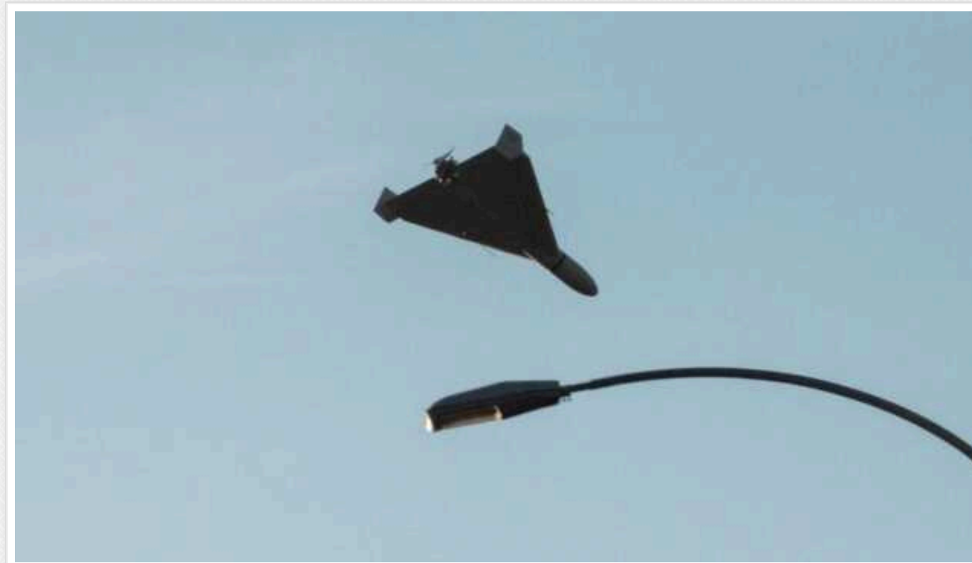
Вночі ВМС знищили два російські «шахеда»

Військовослужбовці ВМС ЗС України сьогодні вночі знищили два російські «шахеда».