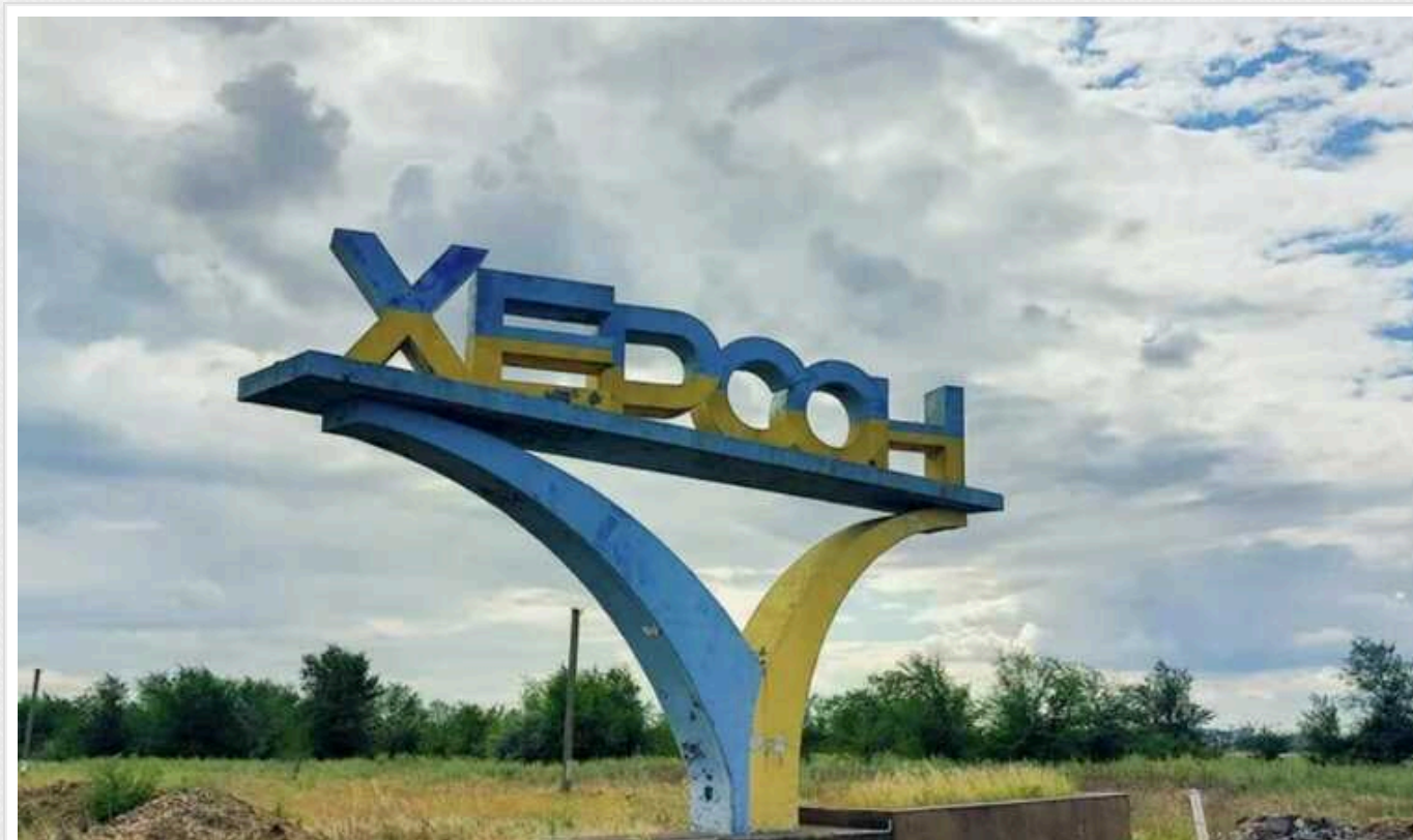
Росіяни вдарили по Херсону: загинула жінка

У ніч проти 24 липня російські загарбники знову обстріляли Херсон. Під ворожим вогнем опинився Дніпровський район міста.