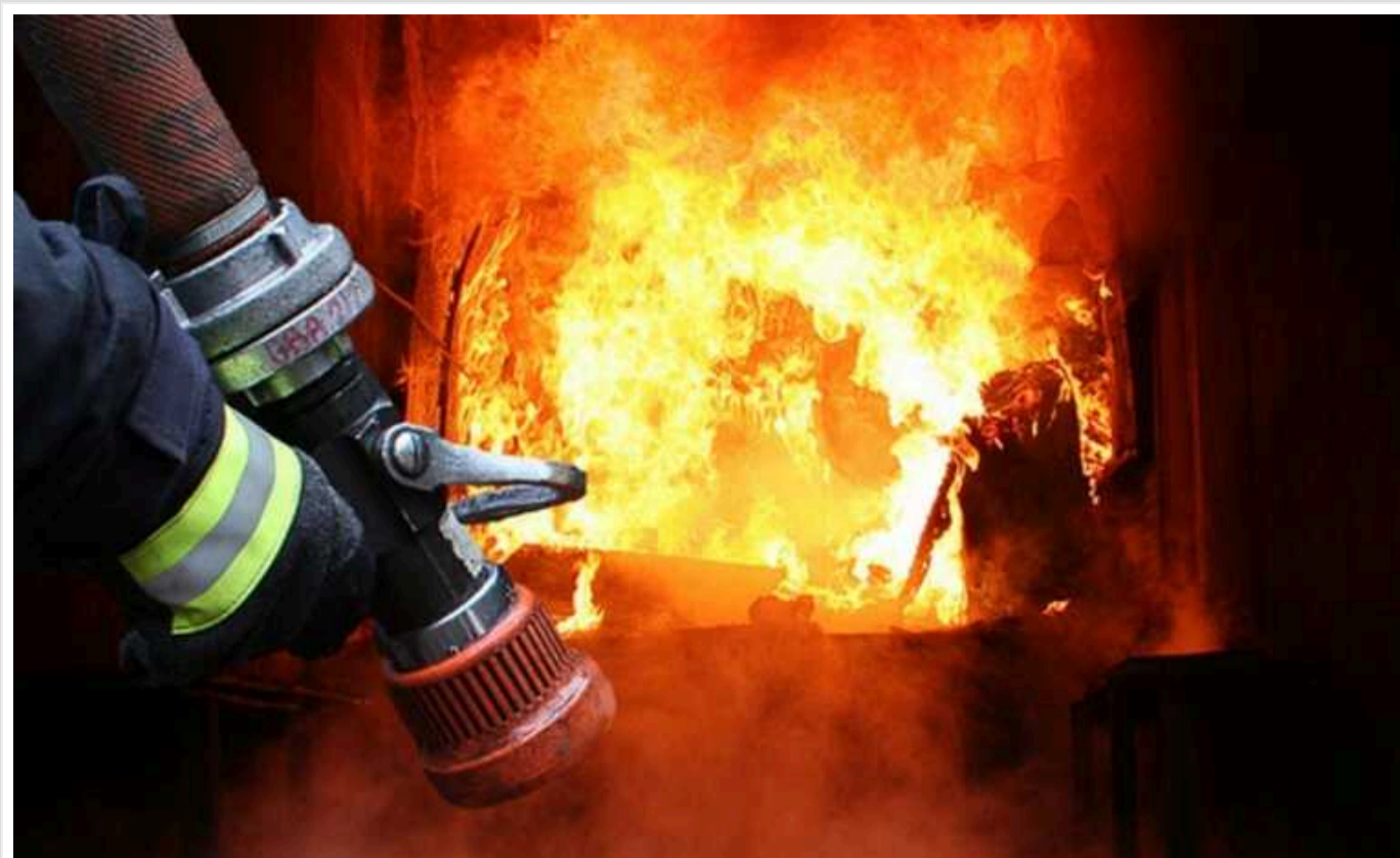
На Харківщині через ворожий обстріл окупантів загорілася цивільна будівля

Російські окупанти завдали удару по Малоданилівській громаді Харківської області. Через ворожий обстріл постраждала цивільна будівля, де сталася пожежа.