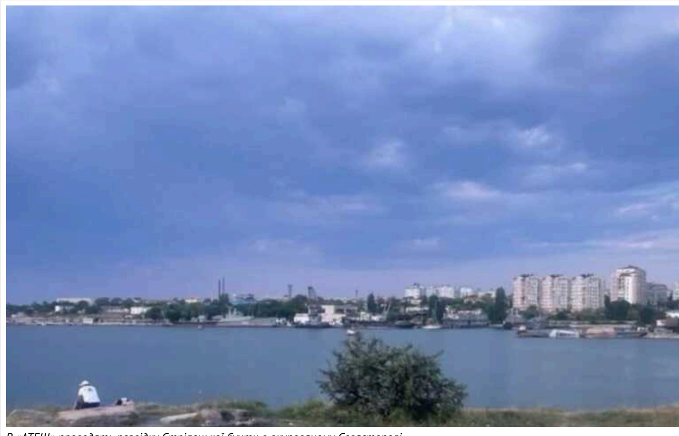
В «АТЕШ» проводять розвідку Стрілецької бухти в окупованому Севастополі

Агенти партизанського руху "АТЕШ" щодня оновлюють місця дислокації військової техніки і суден рашистів у Стрілецькій бухті Севастополя.