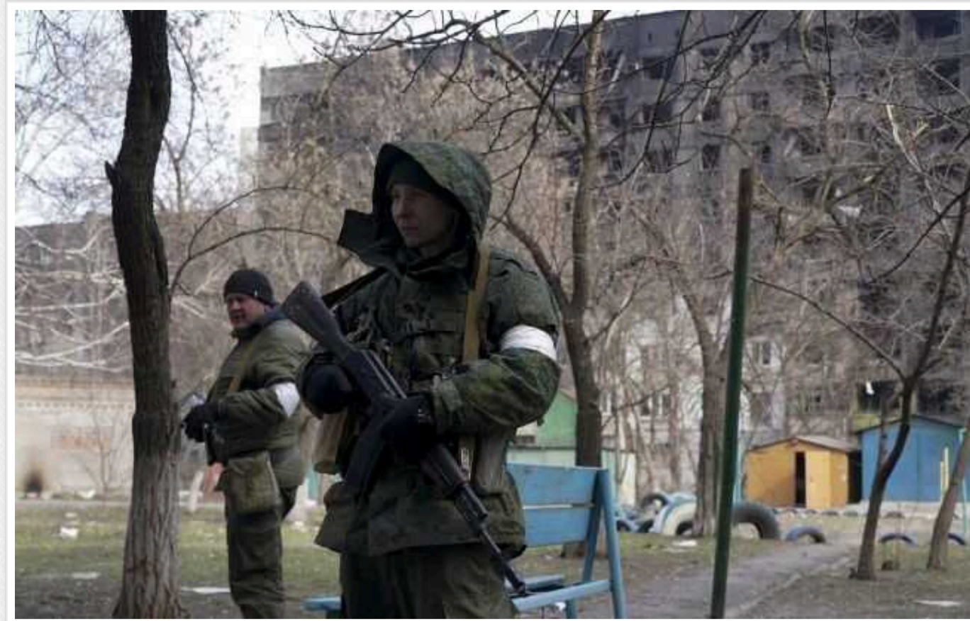
У Ростовській області ЗС РФ розгорнули нову військову базу

База може належати до 100-го військового полку матеріально-технічного забезпечення Збройних сил РФ. На тлі заборони ударів західної зброї по території РФ полк забезпечення перекинули в зону, де його буде важко дістати без далекобійної зброї, припускають журналісти "Схеми".