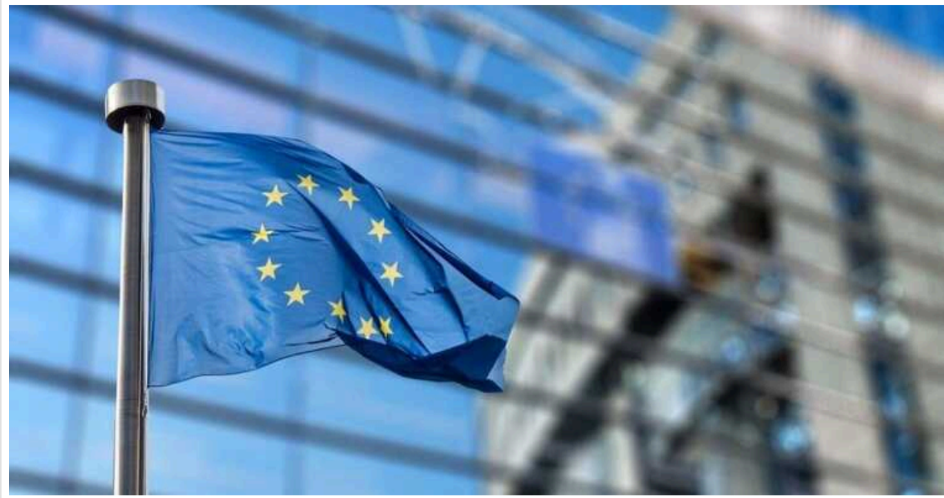
Bloomberg: ЄС запропонував два варіанти заморожування активів РФ на більш тривалий період

Європейський Союз запропонував державам-членам блоку два варіанти щодо заморожування активів російського Центрального банку на більш тривалий період часу.