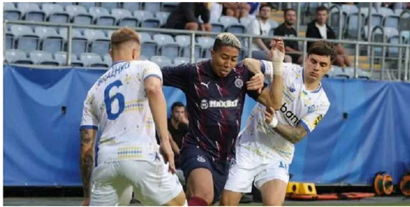
"Динамо" розтрощило белградський "Партизан" у кваліфікації Ліги чемпіонів

Київське "Динамо" здобуло впевнену волевою перемогу над белградським "Партизаном" у 2-му кваліфікаційному раунді Ліги чемпіонів.