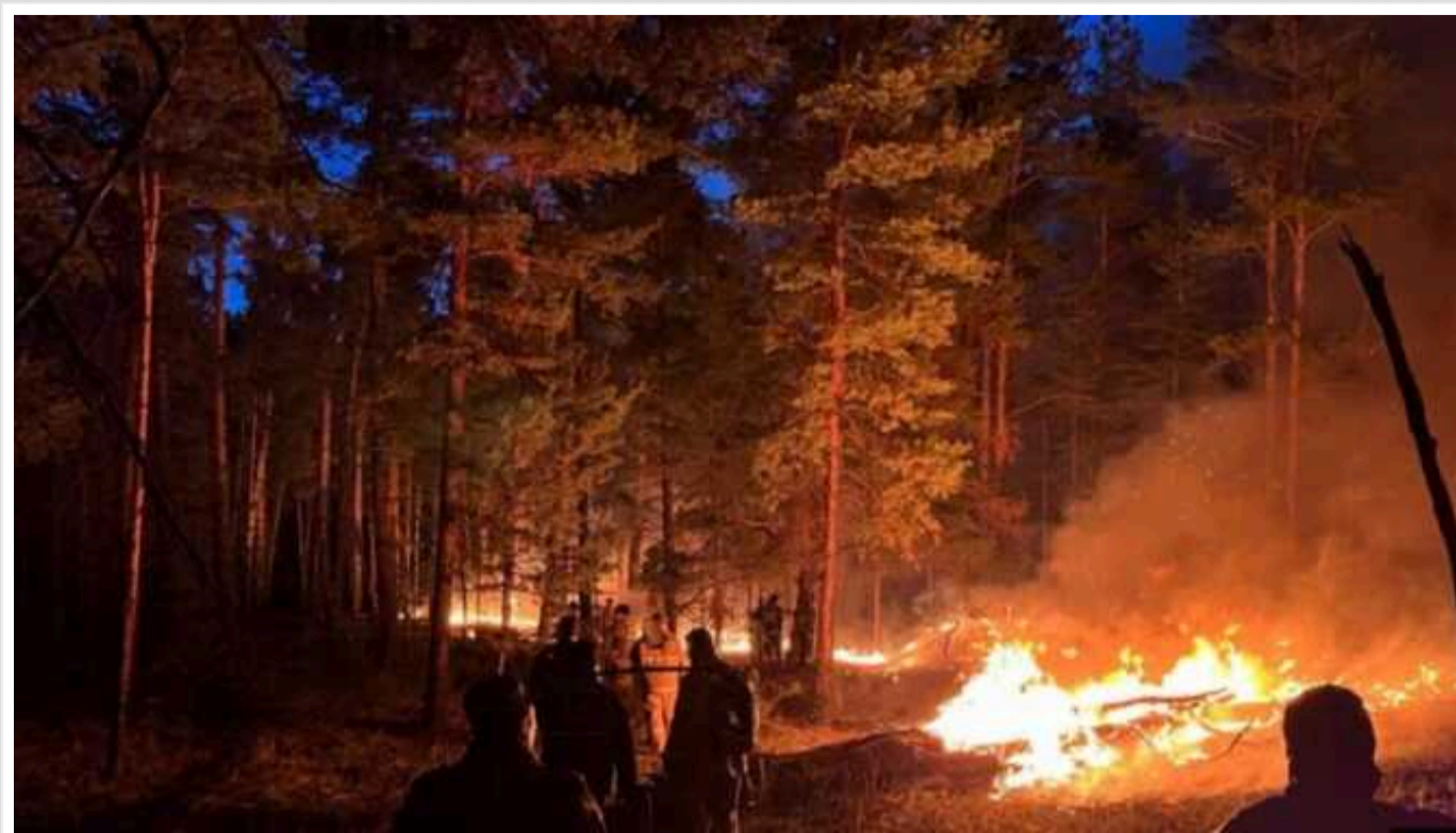
У Росії зафіксували рекордну за останні роки площу лісових пожеж

З початку року в Росії згоріло вже п'ять мільйонів гектарів лісу, переважно тайги. Площа згорілих лісів, понад 99% якої припадає на регіони Сибіру і Далекого Сходу, стала рекордною за останні чотири роки.