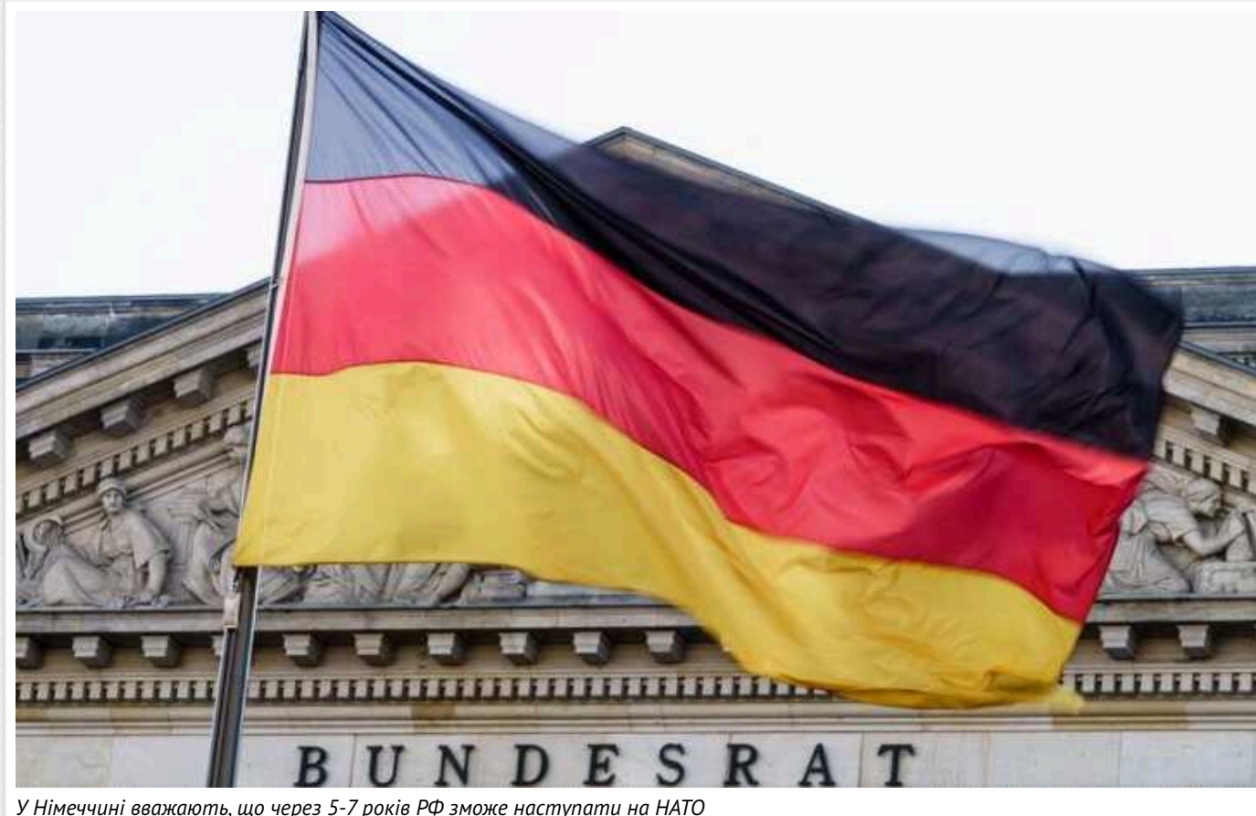
У Німеччині вважають, що через 5-7 років РФ зможе наступати на НАТО

Генеральний інспектор збройних сил Німеччини Карстен Бройер заявив, що через п'ять-вісім років збройні сили РФ будуть оснащені матеріалами та особовим складом, що уможливить наступ на НАТО.