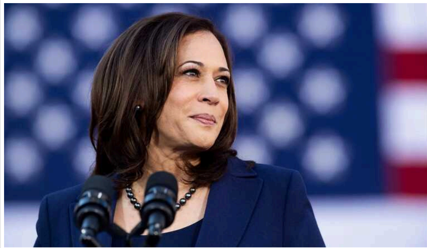
Гарріс випередила Трампа по двох відсоткових пунктах у загальнонаціональному опитуванні, - Reuters

Віцепрезидентка США Камала Гарріс випередила Дональда Трампа по двох відсоткових пунктах в загальнонаціональному опитуванні.