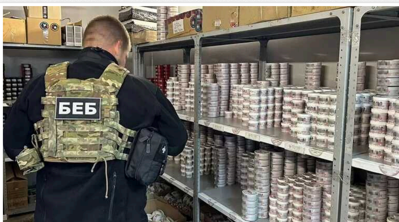
ДТТ з важкими наслідками та елітний відпочинок: У яких скандалах "засвітився" керівник детективів БЕБ Ткачук