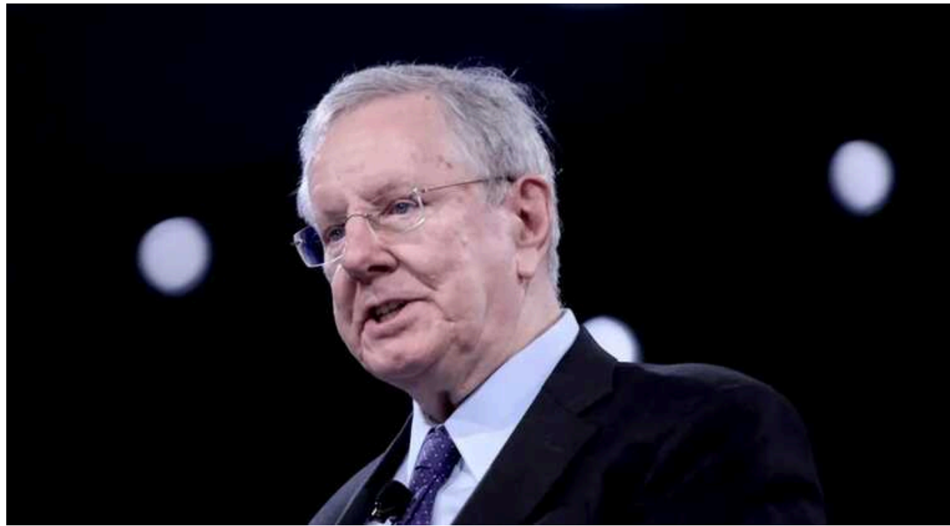
Велика близькосхідна війна неминуча, - Стів Форбс

Головний редактор Forbes Стів Форбс вважає, що велика близькосхідна війна неминуча.