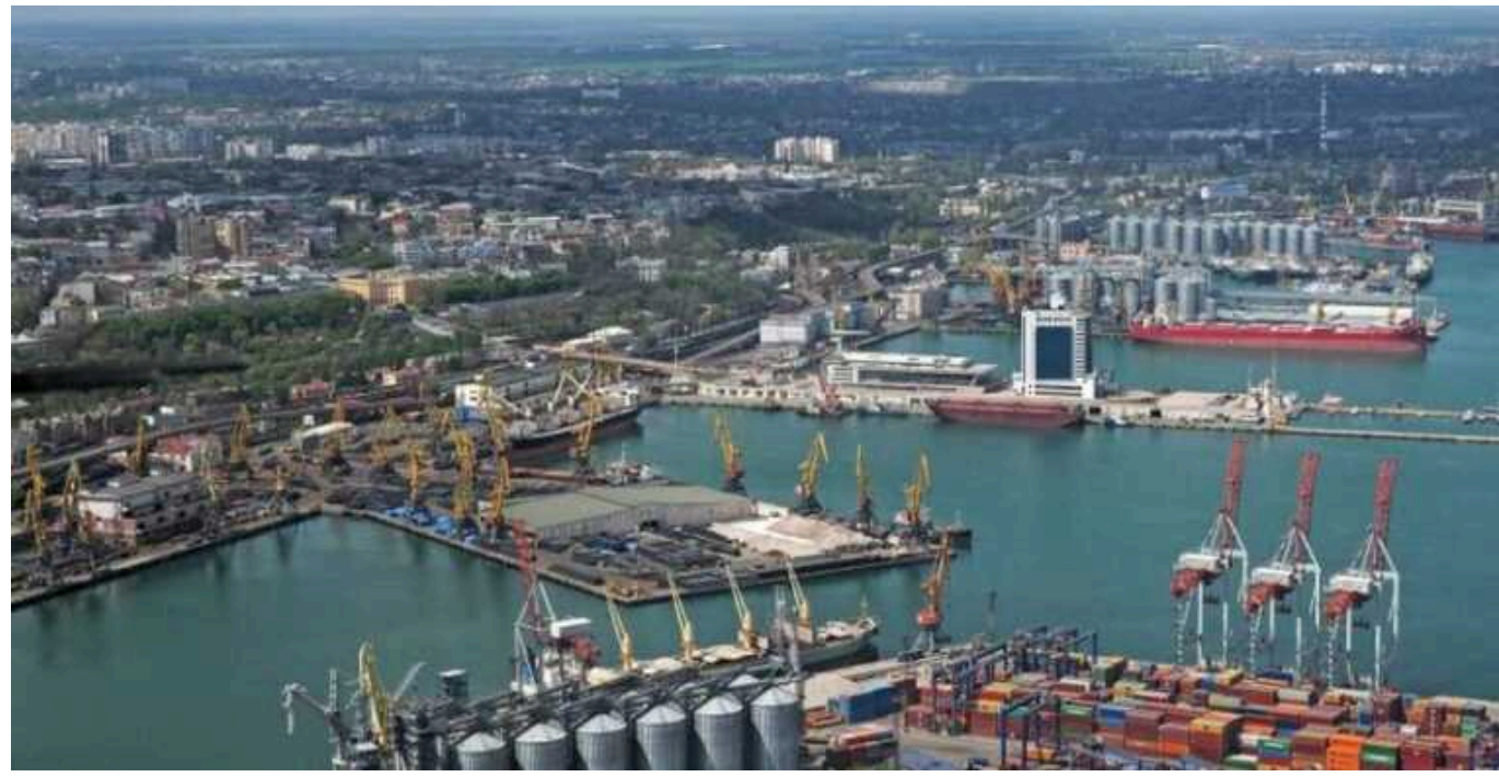
Експозитивні міністра Васцьов причетний до збитків на 2,4 мільярда гривень при розширенні Одеського порту, - ЗМІ

Його назвали «проектот століття». Будівництво нового контейнерного терміналу в Одеському порту, яке розпочалося ще з 2010 року, досі не завершено, але призвело до збитків у 2,4 млрд гривень та затоплений хвилелом у Чорному морі.