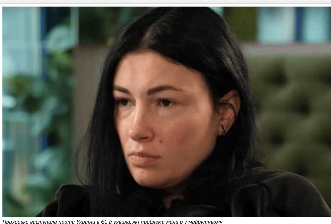
Приходько виступила проти України в ЄС й уявила, які проблеми мала б у майбутньому

Українська співачка, представниця РФ на "Євробаченні 2009" Анастасія Приходько висловила проти вступу України в Євросоюз. Вона шаблонно збирала усі негативні аспекти, які є індивідуальністю певних країн, і приписала їх майбутній Україні у складі коаліції. Зокрема, артистка обурилася відсутністю проведеного референдуму щодо бажання людей бути частиною ЄС.