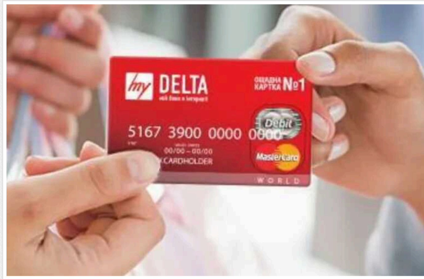
В Україні виставили на продаж активи багатьох банків

Фонд гарантування планує продати активи 8 банків, що ліквідуються. Початкова ціна реалізації всіх лотів становить 497,4 млн грн.