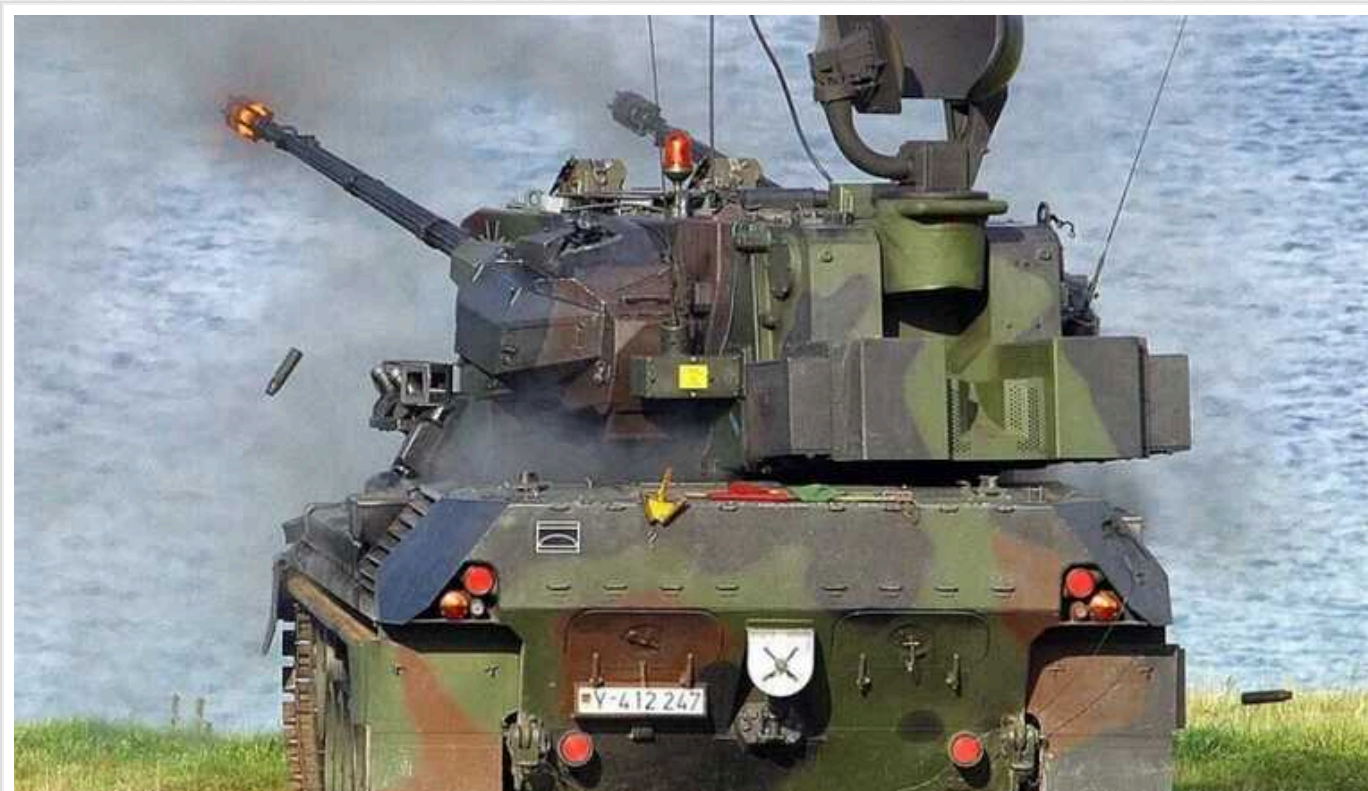
У ЗСУ показали, як німецькі Gepard в Україні полюють на дрони окупантів

На захисті неба над Україною поруч з різноманітними засобами ППО стоять німецькі зенітні самохідні установки Gepard. Швидкострільні та точні, вони відмінно зарекомендували себе у протидії російським дронам-камікадзе.