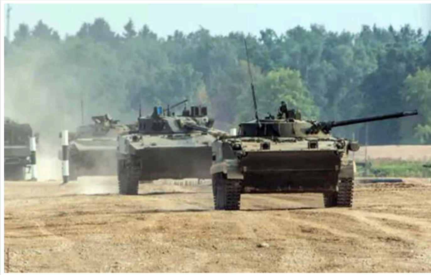
У ЗСУ розповіли, чи готується ворог до нового наступу на Харківщині

На півночі Харківщини російські військові намагаються потіснити підрозділи ЗСУ зі зайнятих позицій. Проте українські бійці завдають відчутних втрат окупантам, розповів речник ОСУВ "Хортиця" Назар Волошин.