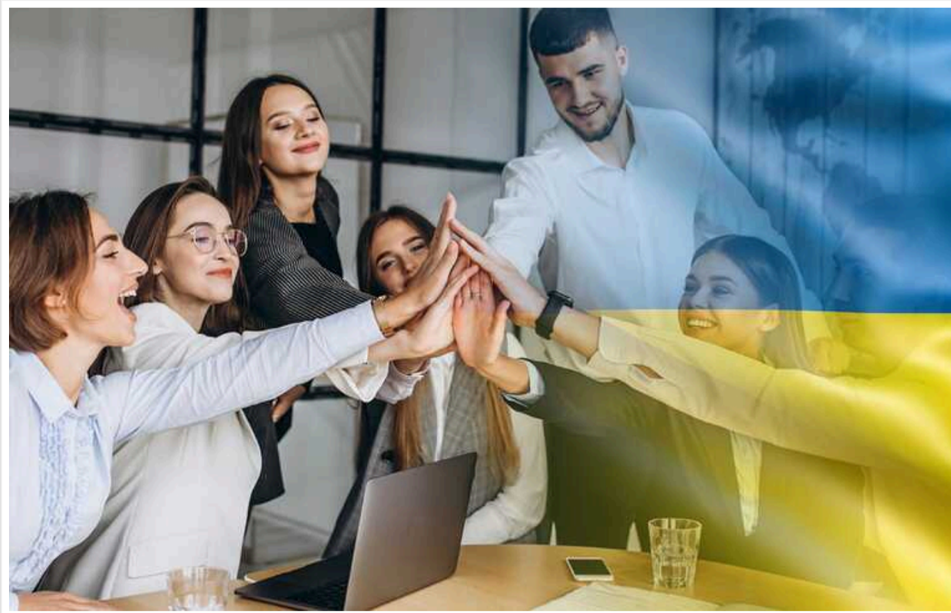
Українські бізнеси розповіли про брак співробітників і не дуже успішні спроби заповнити його наймом жінок

В "Аврорі" кажуть, що дефіцит робочих рук є впродовж усієї війни і зараз становить 8%.