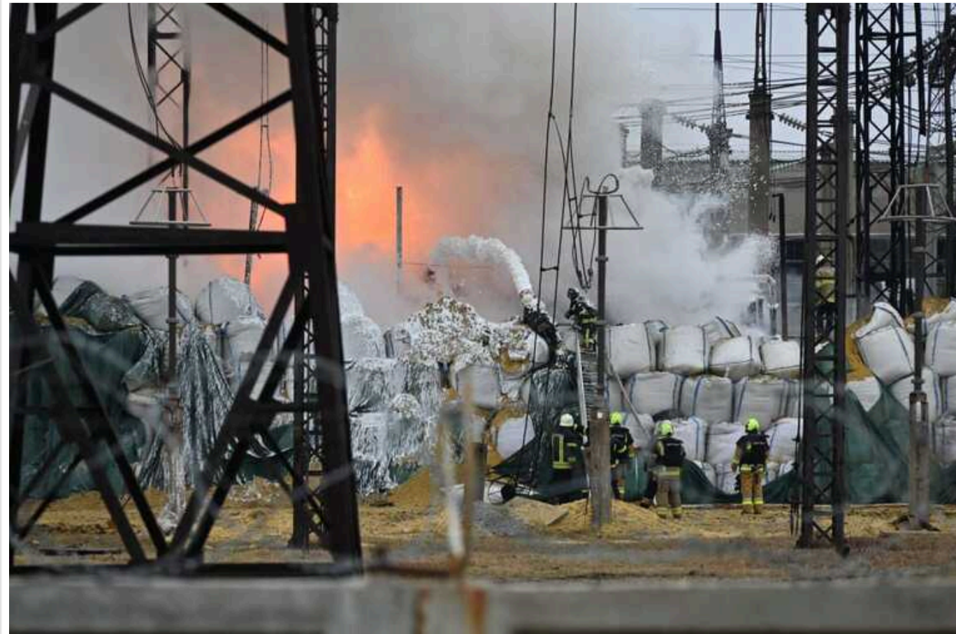
Руйнування в енергетиці зробили неможливою підтримку попереднього тарифу на світло, - Міненерго

Внаслідок суттєвих руйнувань в енергетиці держава втратила можливість фінансувати попередній тариф на електроенергію для населення.