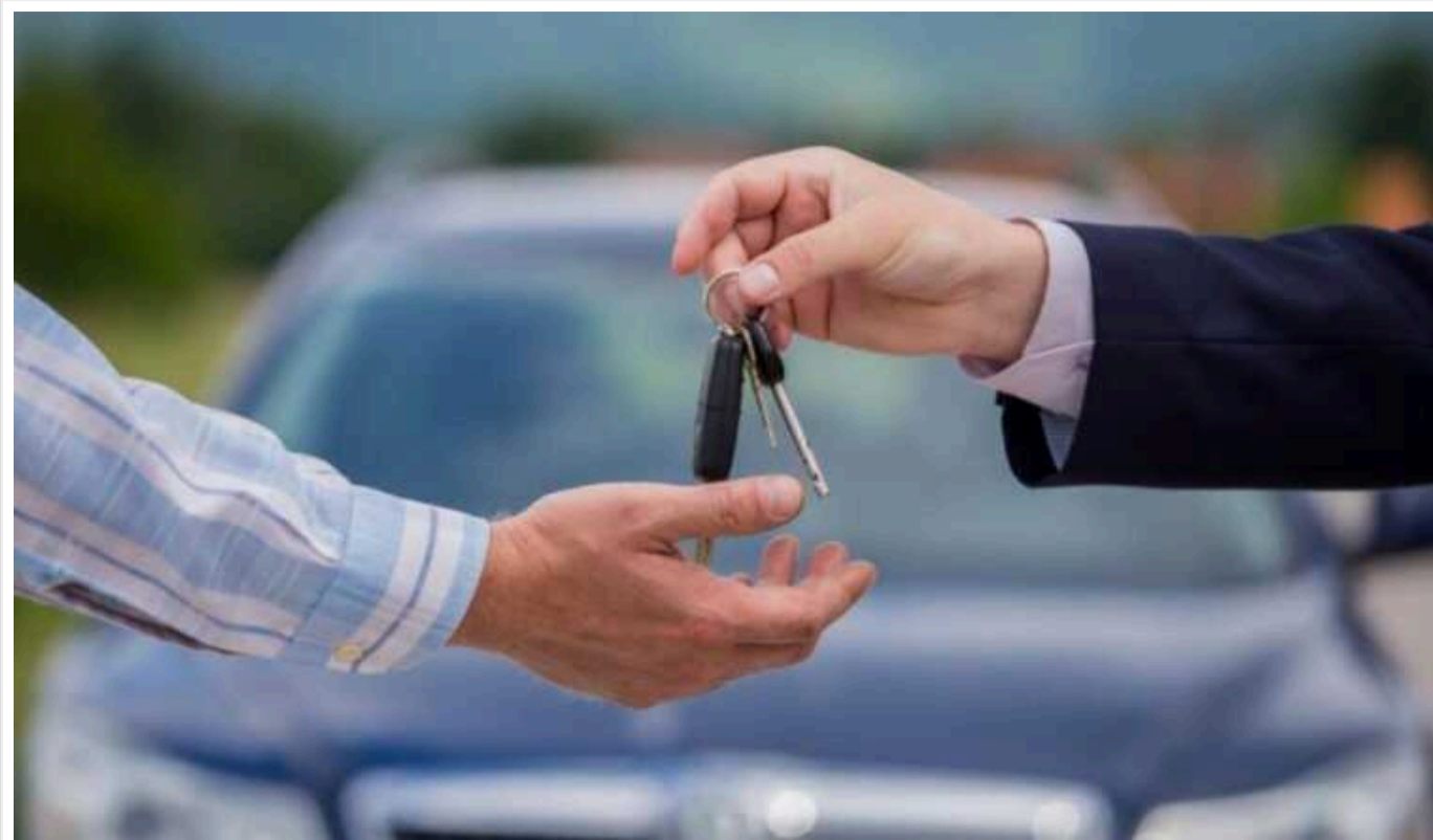
Військовозобов'язані не зможуть перереєструвати автівку, якщо перебувають в розшуку чи мають борги за штрафами ТЦК

Причиною відмови у перереєстрації автомобіля може бути наявність виконавчих проваджень чи перебування у розшуку. Втім, якщо раніше для того, аби дізнатися причину відмови, треба було особисто їхати до сервісного центру МВС, то відтепер під час перереєстрації автівки у застосунку "Дія" можна буде побачити причину відмови.