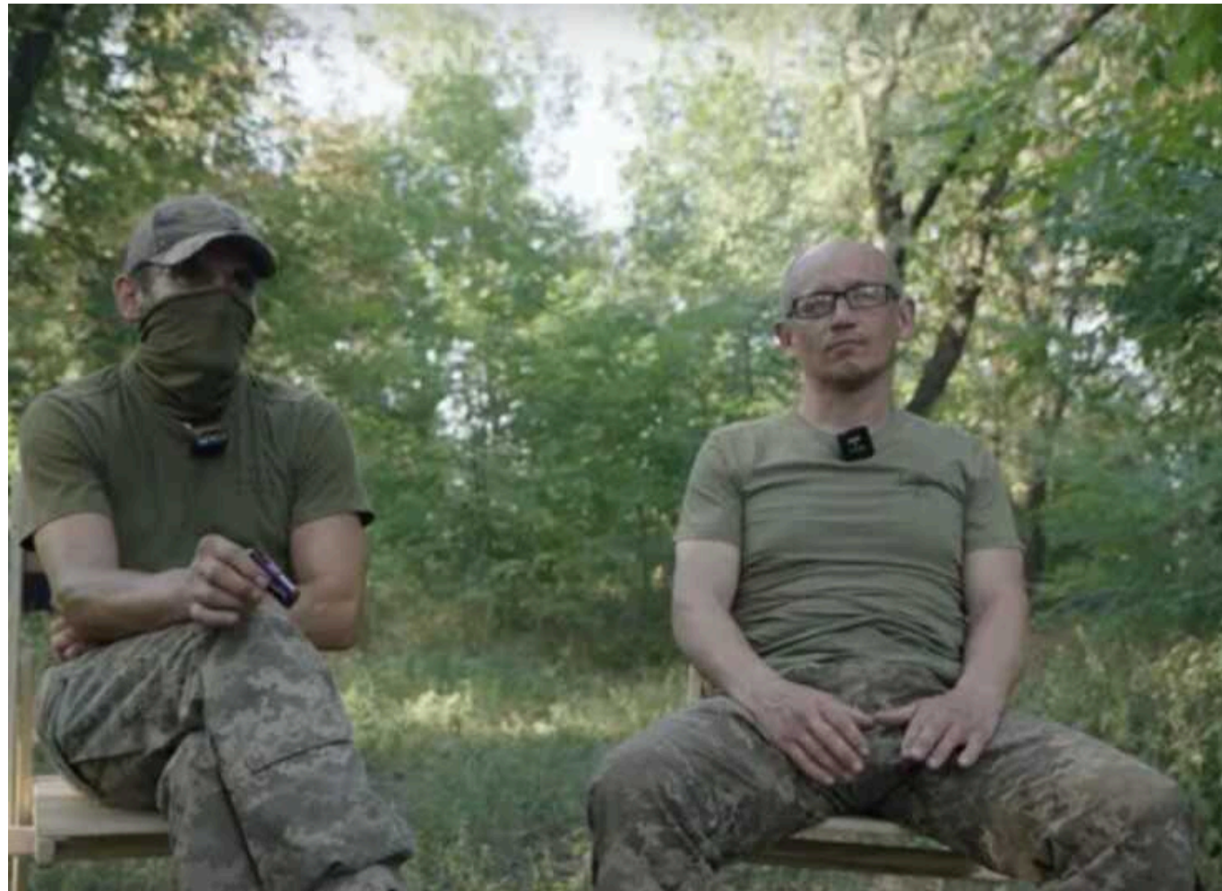
Українські ув'язнені розповіли, що їх мотивувало на службу у ЗСУ і як вони наближають перемогу

У травні 2024 року президент Володимир Зеленський підписав закон №11079-1, який дозволяє мобілізацію певних категорій ув'язнених до Збройних сил України. Після набрання чинності цього закону, деякі українські засуджені обрали службу в армії в обмін на зняття судимості.