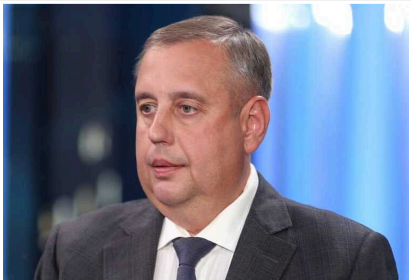
У листопаді САП скерує до суду справу нардепа Ісаєнка

Спеціалізована антикорупційна прокуратура після 3 листопада скерує до суду обвинувальний акт стосовно народного депутата Дмитра Ісаєнка про організацію спроби незаконно заволодіти землею та майном Державного будівельного комбінату.