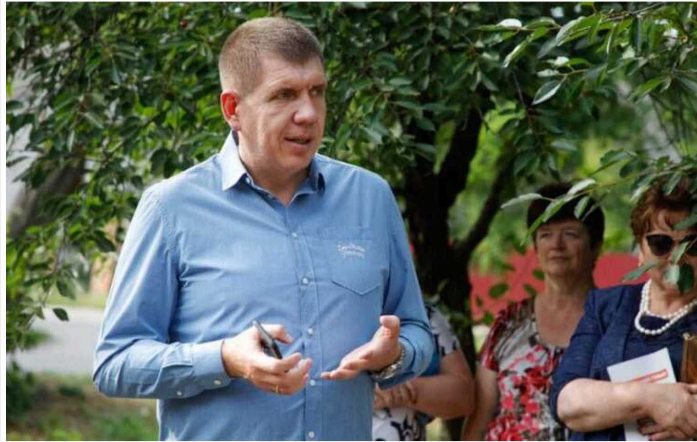
ВАКС продовжив обов'язки нардепу Гуньку

Вищий антикорупційний суд продовжив до 15 вересня строк дії обов'язків, покладених на народного депутата Анатолія Гунька. Спеціалізована антикорупційна прокуратура обвинувачує його у шахрайському заволодінні 85 тисячами доларів та підбурненні до хабарництва.